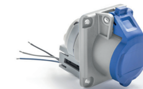
Obj. č. / Item 23M230 CE

SpeedPRO IP 66-67 Vestavná zásuvka s mikrospínačem 75x85 / Microswitch panel socket 75x85