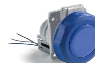
Obj. č. / Item 24M230 CE